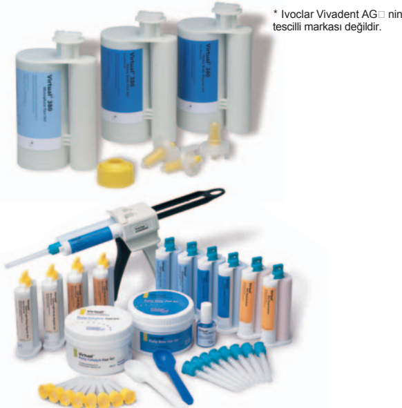
XXL-Kartuşları ile birlikte komple Virtual ürün dizisi

* Ivoclar Vivadent AG'nin tescilli markası değildir.