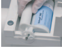
XXL-Kartuşun karıştırma cihazına konulması