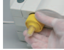
Bajonet halkasını yerleştirin ve saat yönünde çevirerek yerine kilitleyin

Virtual, vinil polisiloksan esaslı hidrofilik bir hassas ölçü materyalidir (A-silikon).