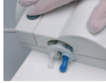
Her iki materyalin eşit akışını sağlamak için karıştırma ucu olmadan materyalin homojen çıkışı