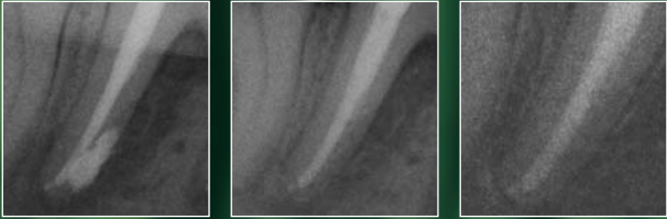
Dolgudan hemen sonra radyolojik durum