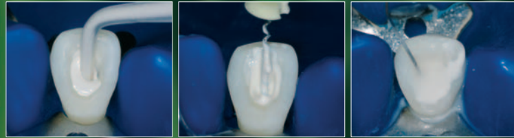
Bir uç ile ApexCal' in kanala uygulanması

ApexCal uygulanan yerde donmaz. Bu yüzden çıkarılması kolaydır.